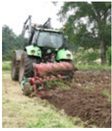
Abb. 1: Umbrechen des zuvor gemähten Grünland- oder gemulchten Ackerwildkraut aufwuchses