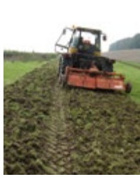
Abb. 3: Fräsen als vorbereitende Bodenbearbeitung für die Nachsaat