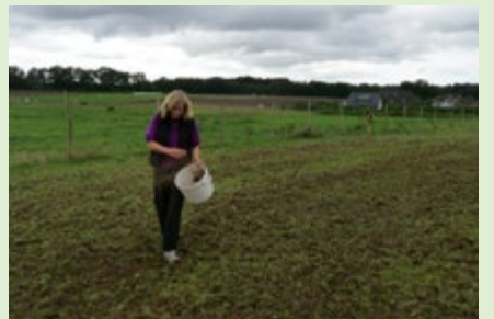
Abb. 9: Aussaat per Hand

! Bei Drillmaschinen, die keine Ausbringung von geringen Saatgutmengen zulassen, muss das Saatgut mit Sojaschrot oder Feinsand min. im Verhältnis 1:1 gestreckt werden. Auf eine gute Durchmischung des Saatguts mit dem Streckmittel ist zu achten.