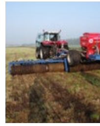
Abb. 5: Striegeln einer Fläche mit Saatstriegelkombination