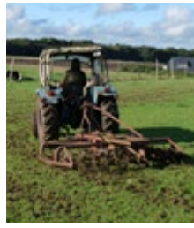
Abb. 4: Eggen als vorbereitende Bodenbearbeitung für die Nachsaat. Hier reicht ein einmaliger Arbeitsgang nicht!