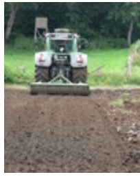
Abb. 2: Eggen und Anwalzen als abschließende Bodenbearbeitung für die Ansaat