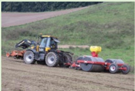
Abb. 7: Aussaat und Anwalzen mit Saatkombination