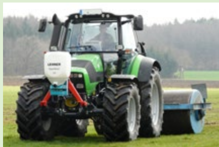
Abb. 8: Lehner-Streuer